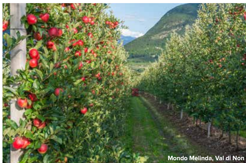
Mondo Melinda, Val di Non

Ciclo dei Mesi, uno dei più affascinanti cicli pittorici di tema profano del tardo Medioevo. Pranzo libero. Nel pomeriggio proseguiamo con la visita del Museo Diocesano di Trento. Venne fondato nel 1903 allo scopo di salvaguardare il patrimonio artistico della diocesi e con l'intento di farne strumento didattico per la scuola d'arte e di archeologia cristiana del Seminario Teologico. Partenza alla scoperta di una piccola cantina in Piana Rotaliana per degustare il famoso Teroldego e assaporare la metodologia di questo vino. Rientro in hotel. Cena e pernottamento.